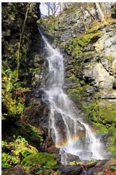
Slika 11: Sedelnikov slap

Ekološka kapelica je bila zgrajena leta 1997, posvečena je sv. Frančišku Asiškemu. Tamkaj živeče ljudi varuje in opozarja na jez Golica/Koralpe, zgrajen na drugi strani državne meje v Avstriji, v občini Soboth. Kapela služi kot simbol in opozarja na nevarnost, ki preti dolini Bistriškega jarka – na poplavni val vode, zajete za jezom, ki bi poplaval dolino, če bi jez popustil (okoli 22 milijonov m 3 vode v umetno zajezenem jezeru).