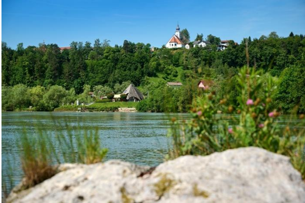
Slika 6: Mitnica

Pot se nadaljuje do Mitnice, po kateri je naš kraj dobil ime. Mitninska postaja naj bi tu bila postavljena v 12. stoletju, ko je bila na to območje prestavljena deželna meja med Koroško in Štajersko. Mitnina je davek, ki se je pobiral od pretovorjenega blaga, danes jo bolj poznamo kot carino.