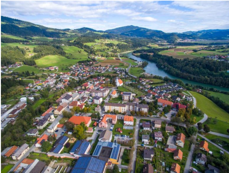
Slika 2: Muta

Podnebje na območju Mute je zmerno celinsko, z razmeroma hladnimi zimami in toplimi poletji. Naravne danosti so ugodne za razvoj turizma, zlasti pohodništva, kolesarjenja in rekreacije v naravi, kar predstavlja pomembno razvojno priložnost kraja.