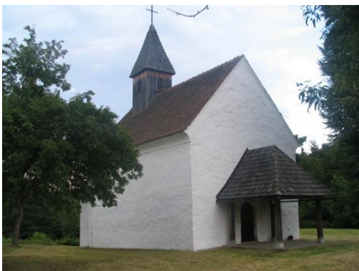
Slika 5: Cerkev sv. Petra na Ribičju

Na Ribičju na Spodnji Gortini stoji cerkev sv. Petra, prvič omenjena leta 1326. Gre za enoladijsko cerkev z romanskimi in gotskimi elementi ter zgodnjebaročno opremo. V glavnem oltarju stoji kip sv. Petra z začetka 16. stoletja, v cerkvi pa je ohranjen tudi antični nagrobnik.