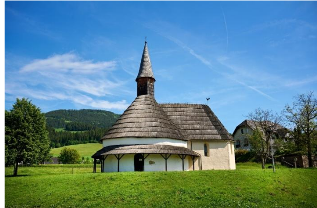
Slika 7: Rotunda sv. Janeza Krstnika

Rotunda sv. Janeza Krstnika na Spodnji Muti je romanska cerkev iz 11. stoletja, ki velja za eno najstarejših cerkvenih zgradb na tem območju. Zgrajena je kot okrogla verska stavba (rotunda) z obokanimi stenskimi poslikavami iz 14. stoletja in lesenim stropom iz poznega 16. ali začetka 17. stoletja, kar ji daje poseben umetnostnozgodovinski pomen. Rotunda se nahaja ob izlivu Mučke Bistrice v reko Dravo. Ima okroglo ladjo in lepo skodlasto streho z nadstrešnim stolpičem. Na svoji poti po Koroški in Štajerski naj bi jo leta 1052 posvetil papež Leon IX. Na zunanji steni je s skodlasto streho pokrit obhod, kakršen je nekdaj obkrožal stavbo.