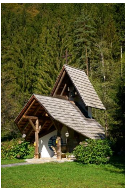
Slika 10: Ekološka kapelica

Zaključna postaja poteka v naravnem okolju, kjer se obiskovalci ustavijo pri Ekološki kapelici in Sedelnikovem slapu. Slap se nahaja v slikoviti dolini, ki nosi ime Bistriški jarek. Do slapa preko potoka Bistrica vodi manjši most. Do samega slapa nato vodi markirana planinska pot. Sedelnikov slap je visok 23 metrov in je s tem najvišji slap na območju Kozjaka. Njegova posebnost je, da na samem vrhu teče enovito, proti koncu pa se voda razcepi na tri krake. V bližini slapa se nahaja Ekološka kapelica.