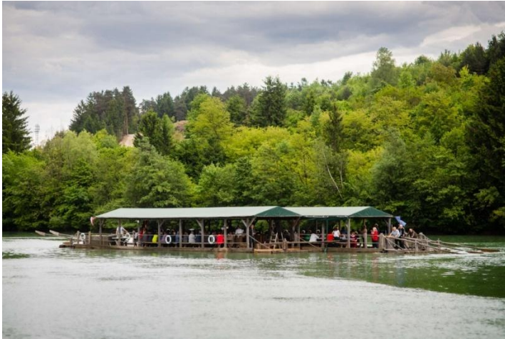
Slika 4: Splavarjenje

splavarjev, ki so po reki prevažali les in druge dobrine. Danes pa je splavarstvo pomembna turistična atrakcija našega kraja.