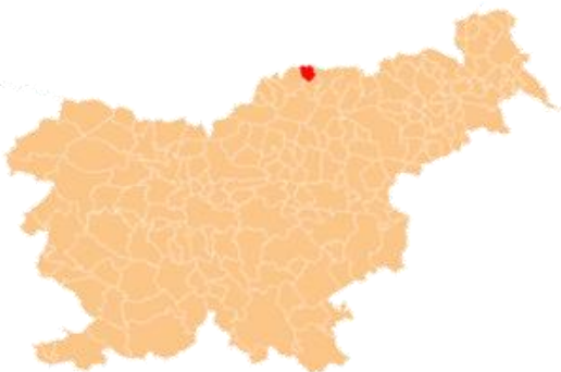
Slika 1: Občina Muta

Muta je gručasto naselje ob cesti Maribor–Dravograd, ki leži v severovzhodni Sloveniji ob meji z Republiko Avstrijo. Spada v Predalpske pokrajine, na severu jo omejuje Kozjak, na jugu pa reka Drava. Sestavljena je iz starejšega naselja Spodnja Muta ob Mučki Bistrici pod dravsko teraso in novejšega naselja Zgornja Muta, kjer se nahaja tudi večina storitvenih dejavnosti. Občina Muta meri 39 km 2 in šteje nekaj več kot 3300 prebivalcev.