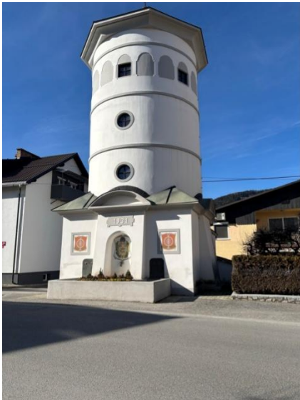
Slika 8: Vodni stolp

predmete za predstavitev etnološkega dela so zbrali v začetku sedemdesetih let, zbirka pa je izvorno vezana na hribovske kraje v okolici Mute. Predstavljeni so predmeti vsakdanje rabe in kmečko orodje s konca 19. in prve polovice 20. stol. Gasilski muzej v sklopu muzeja na Muti je od skromnega začetka z razstavo gasilskih vozov napredoval v osrednji gasilski muzej za Koroško, kjer so poleg različnih tipov prevoznih sredstev na ogled še gasilske črpalke, brizgalne in zastava, gasilske uniforme, čelade, druga gasilska zaščitna oprema in drugo. Del zbirke je tudi postavitve na prostem v okoliškem parku, v katerem so predstavljeni večji delovni stroji iz kovačije.