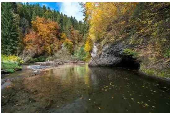
Slika 9: Ajskeler